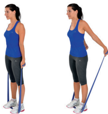
Latissimus Dorsi & Teres Major